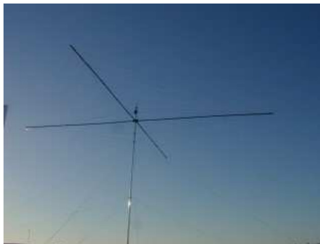
Redan första dagen kom en av Spiderbeamarna upp