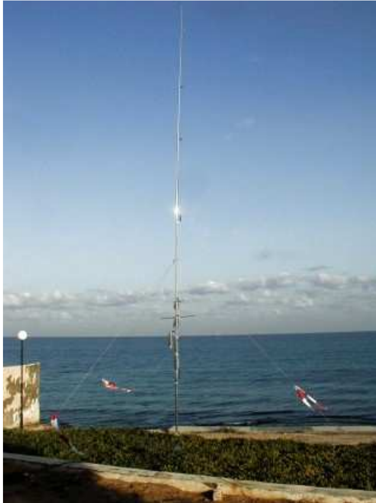
Butternut HF6V monterad vid strandkanten