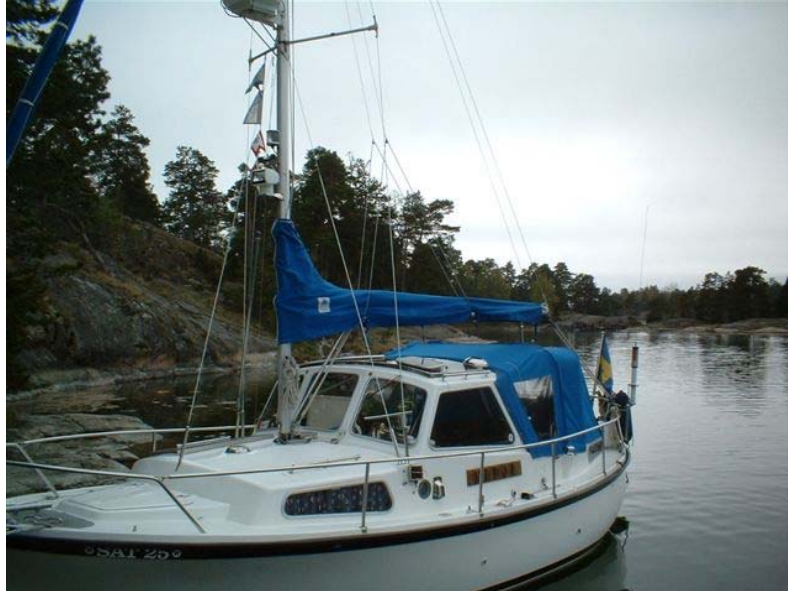
Nadja förtöjd vid Ämtö

Sven-Arno har under sommaren varit en av de aktiva på Norrköpingsringen 3775 ±QRM. Favoritställena finns i Östgötaskärgården och såväl morgon som kväll har vi kunnat höra SM5MCZ/MM på bandet. Ibland med den nya screwdriverantennen ibland med en longwire till en tall på lagom avstånd.